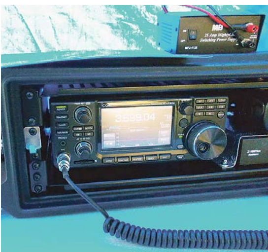
Icom-7300 kesäkuumalla Lylyssä.