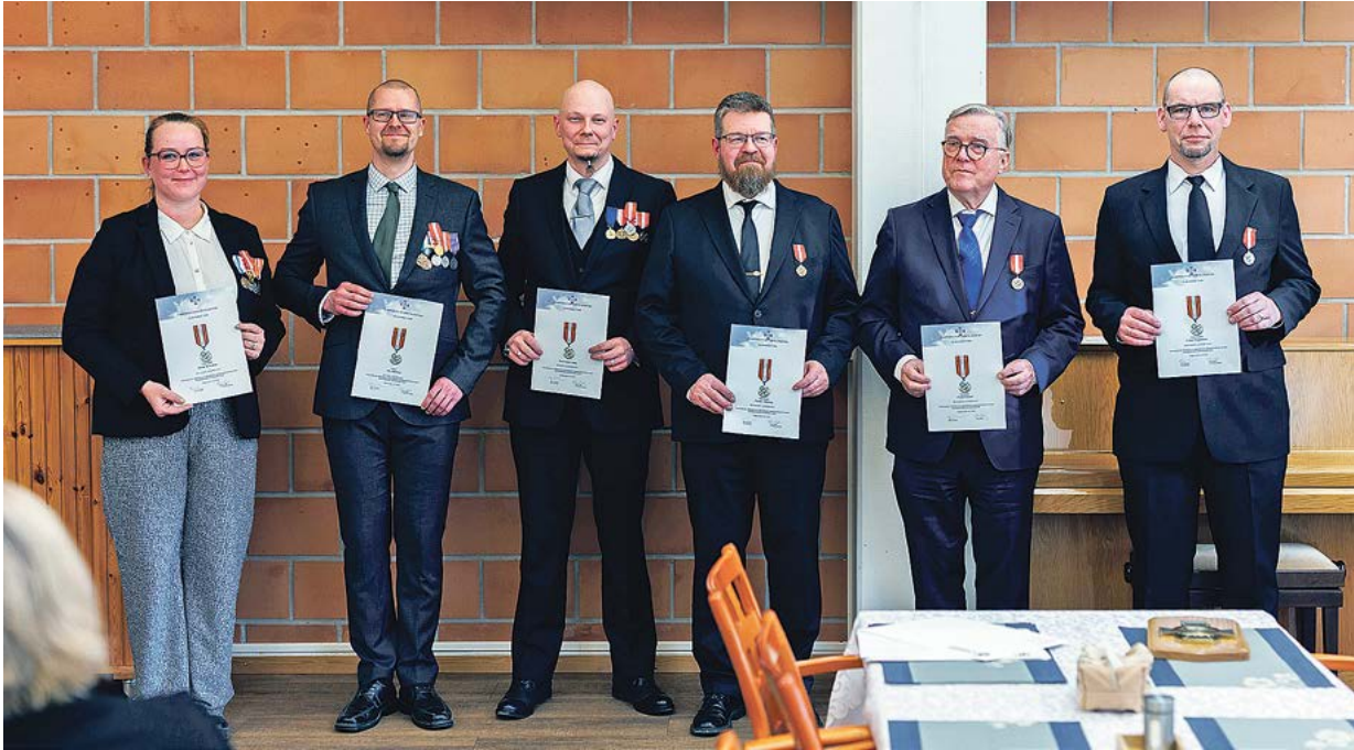
Yhdistyksen omat pronssiset, hopeiset sekä kultaiset ansiomitalit jaettiin kevätkokouksessa.