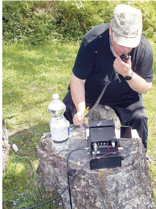
”Puskaradisti” harrastuksen touhussa kannonnokassa.