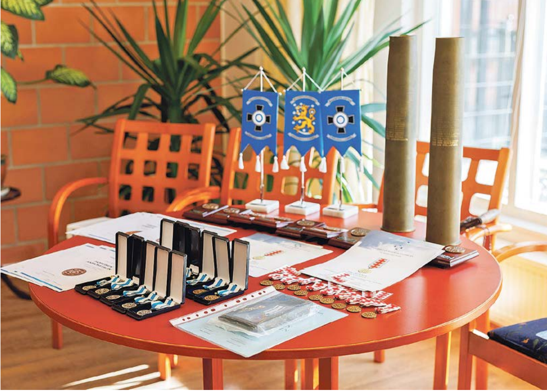
Mittava palkintopöytä odotti palkittavia.