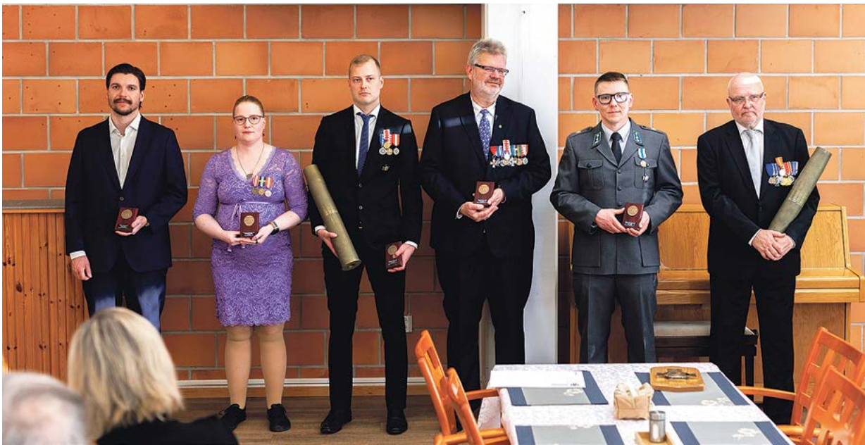
Myös vuoden 2025 toimijat saivat huomionosoituksensa.

Tampereen Reserviläisten kevätkokous pidettiin keski- viikkona 22.4. ravintola Mama no Bentossa Hatanpää- lä. Paikalla oli runsaasti yhdistyksen väkeä sekä ra- vintolan kanssa samassa talossa toimivan senioritalo nasukkaita.