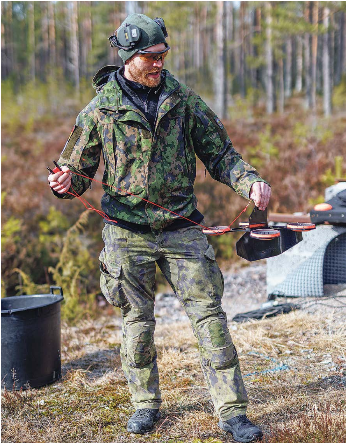
Drooniammunnoissa maalina toimi neljästä kiekosta rakennettu lennätettävä maallilaite.