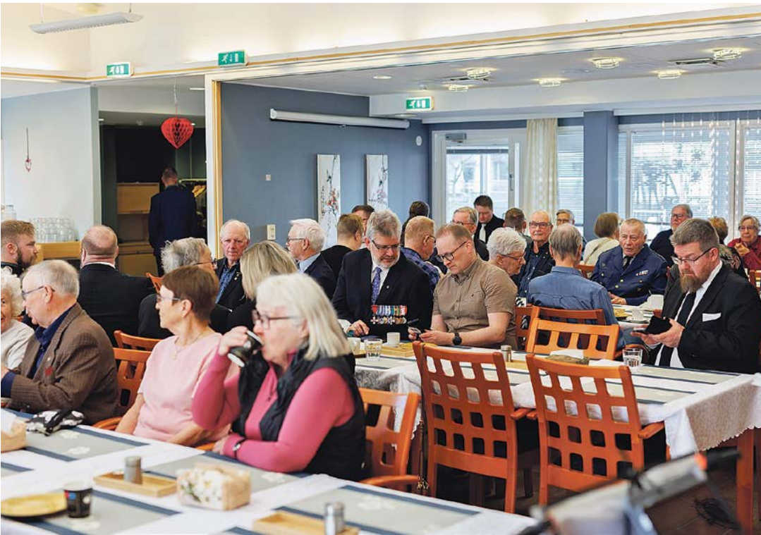
Kokouskahveilla oli runsas määrä yhdistyksen sekä viereisen palvelukodin väkeä.