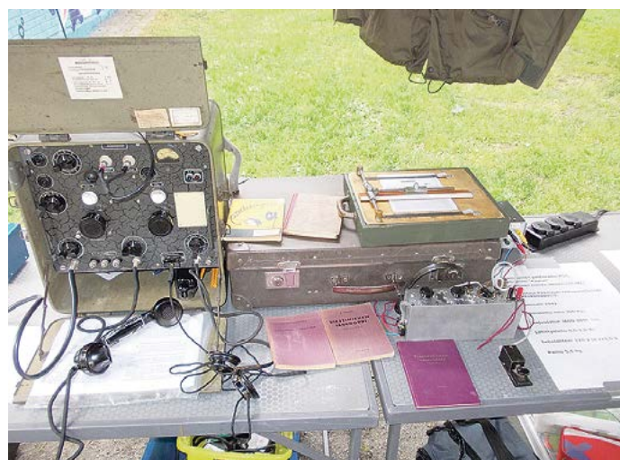
VRFK, matolaatikko ja Kyynel esittelyssä.